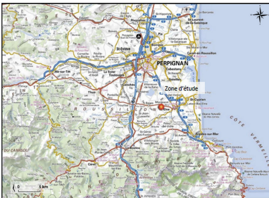
Fig. 1 : Plan de situation

Malgré ce contexte, la commune de Montescot a prévu une extension urbaine dans le secteur « Chemin de Saint-Martin » au sud du centre ancien en continuité d'une zone bâtie mais en retrait du village. Cette extension présente une superficie de 12 ha.